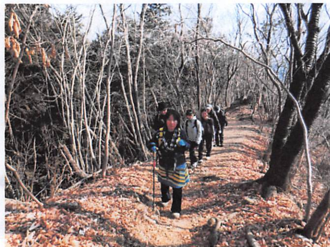
尾根までもう少しです、がんばりましょう。