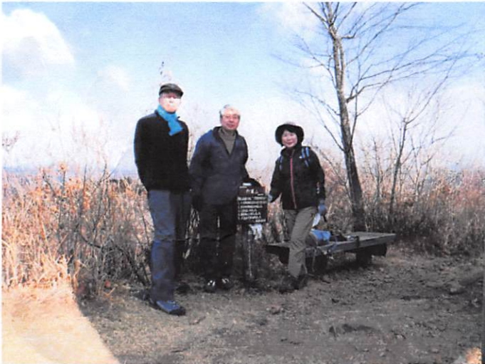
am9:34 行道山頂標識・栃木百名山(442m)