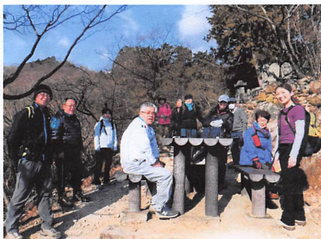
am9:08 寝釈迦前で一休み。