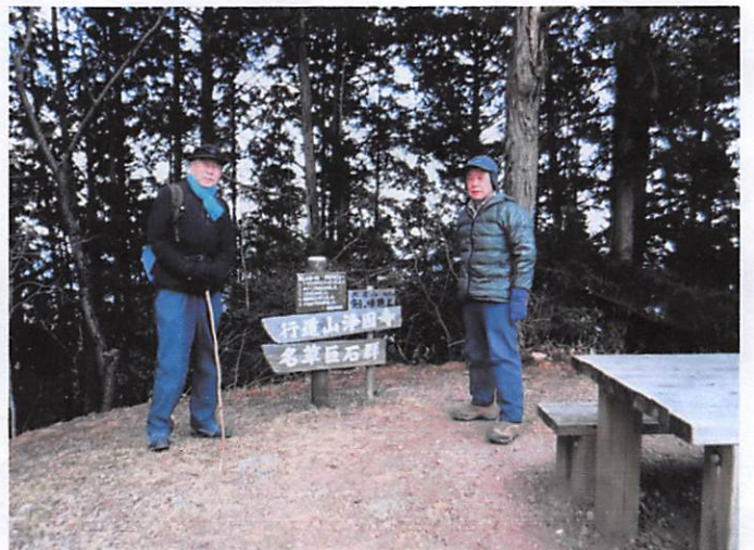
am9:58 大岩山剣ヶ峰頂上(417m)