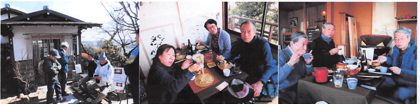
下山後の楽しみ、ちょっと飲んでさっといたく、名物のそばに舌鼓。