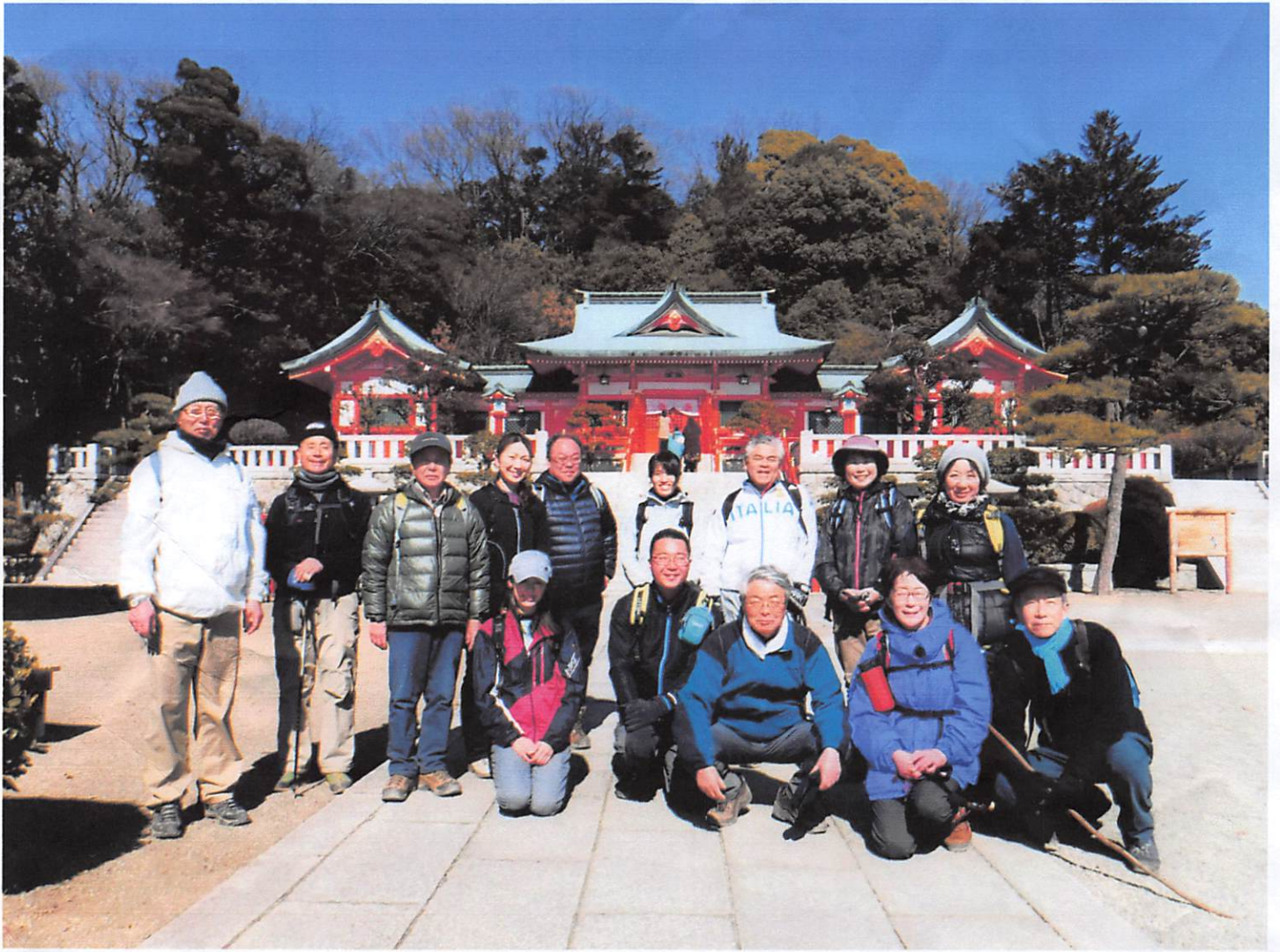
pm0:57ご苦労様でした。終点の織姫神社到着の面々