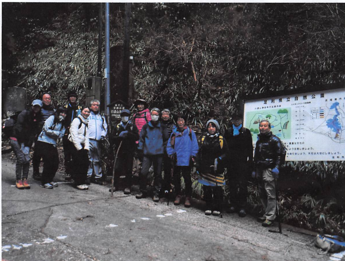
am8:40 今日は大勢の皆さんに参加していただいたの山行です、楽しく歩きたいですね(駐車場)