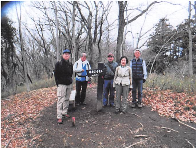
道標やベンチの整備良好