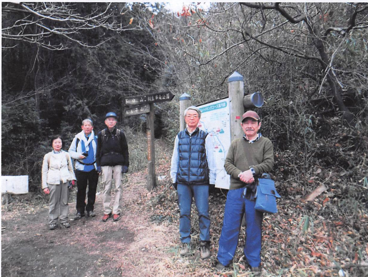
am10:42登山口に戻りました、下りは50分でした。