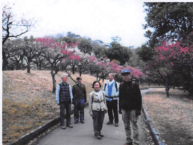
最終日ですがまだまだみられる。