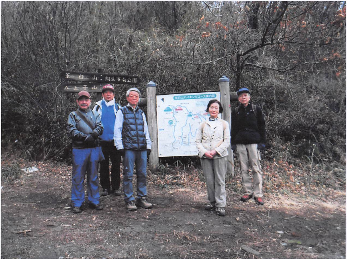
am8:21 県道からの登山口