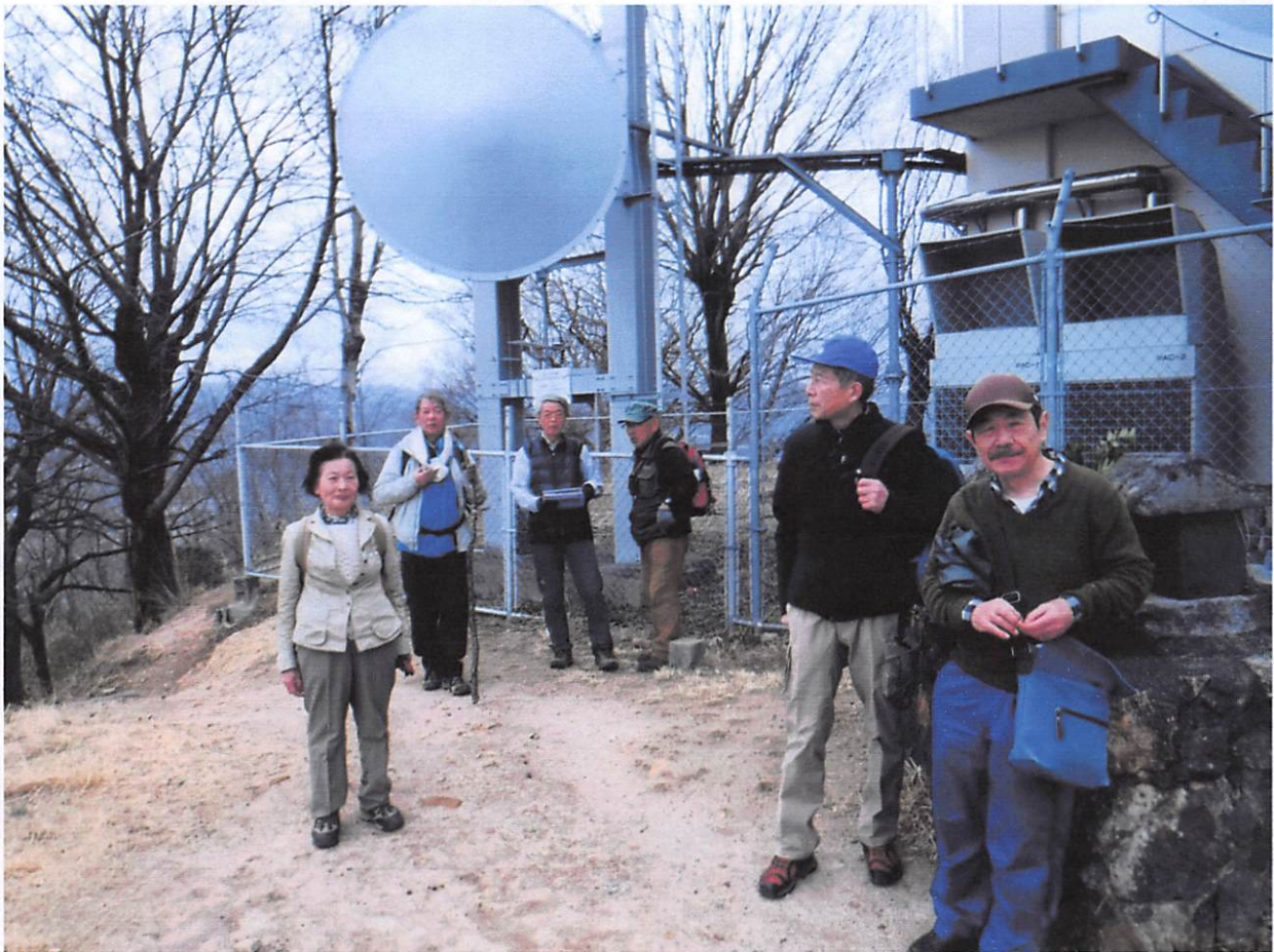
am9:26 電波塔のある頂上です、登山口からゆっくり歩いて65分でした。