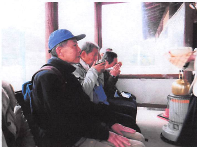
南公園梅まつり・野点でお茶を頂く。