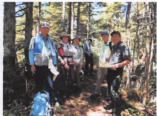
晴天で日差しが強いことから、樹林の中を歩くこの「茅の尾根コース」で大助かり。