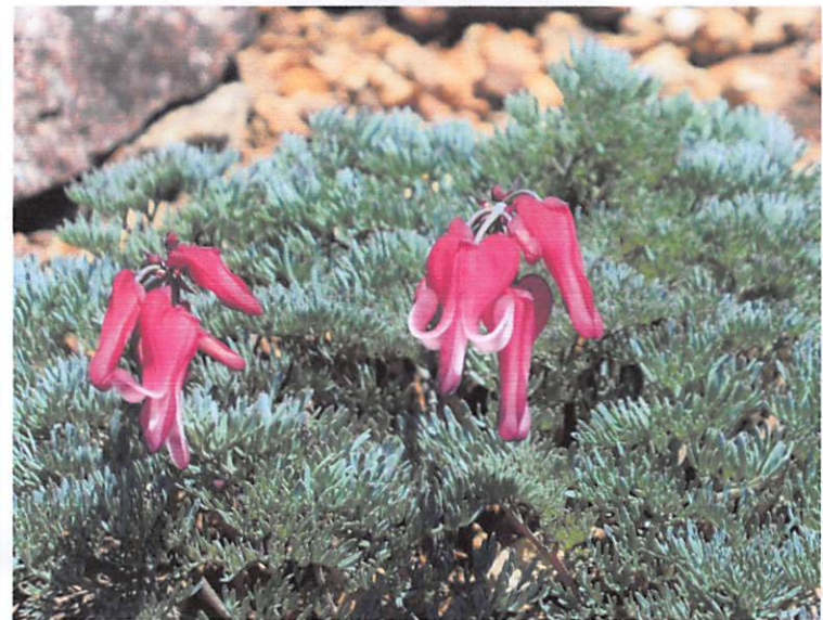
コマクサ (高山植物の女王です)