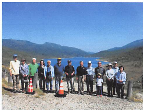
富士見峠に勢ぞろい(バックは野反湖)