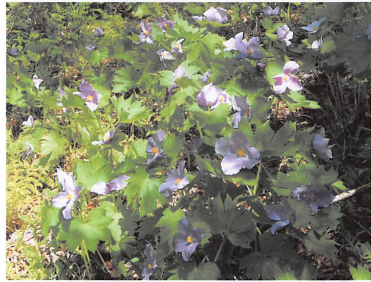
シラネアオイ (群落で見ることができた)