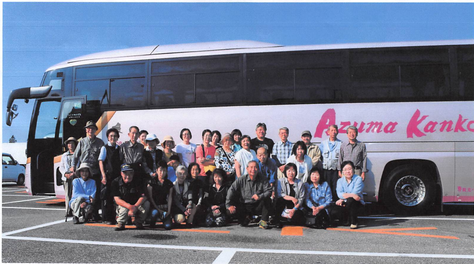
長野道梓川SAにて:上高地では下車の場所がそれぞれ異なるため参加者全員の唯一の写真です