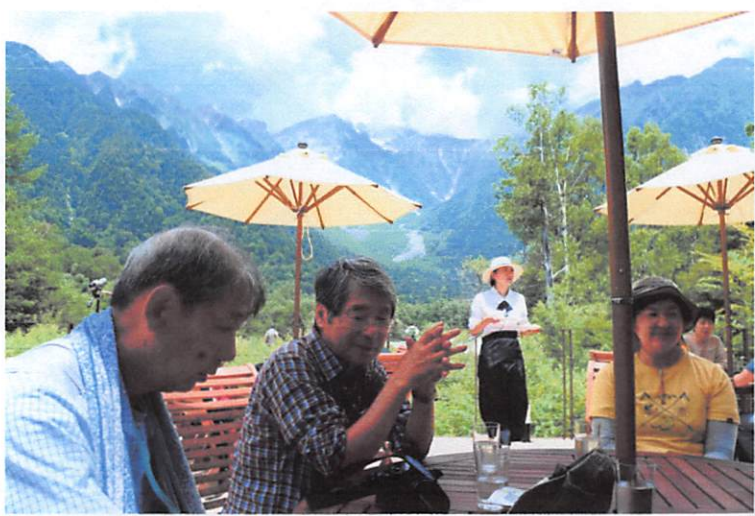
穂高を望むテラスで休憩