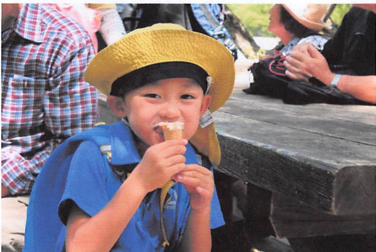
景色がいいのでおいしい氷がアツプです