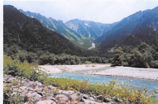
梓川と穂高連峰の山並み