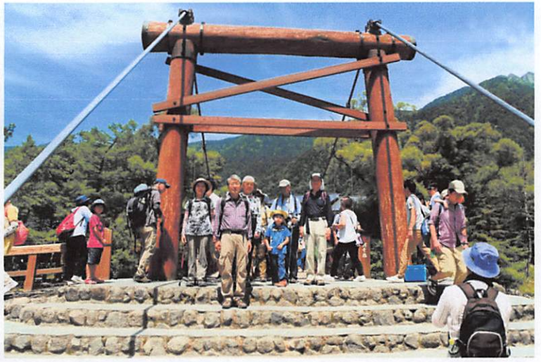
上高地のメインスポットの一つの、河童橋