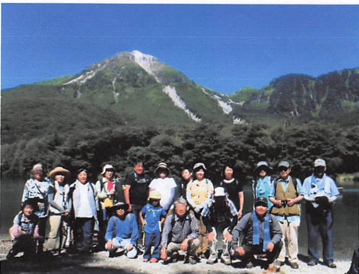
下車して大正池から梓川沿いに河童橋方面に向けて歩き出しましたが、まだこの辺では皆さん一緒です (背号は大正池と榛兵)