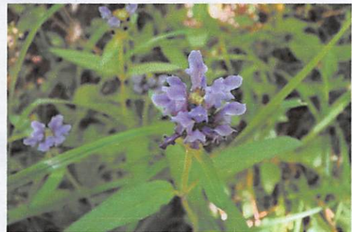
いろいろな花が見られました。