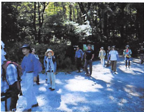
下車して大正池から河童橋を目指して