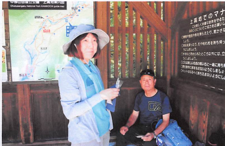
田代橋左岸橋詰休憩所、ここから帝国ホテル方面の分岐