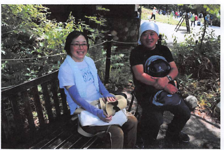
今日はもう十分堪能しましたと？

日差しは強いがからりとして気持ちがいい、日堂を離れて皆さん思い思いに楽しんでいただけたと思います。