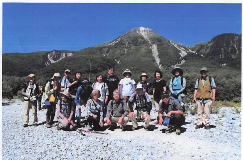
(背号は梓川と榛兵)