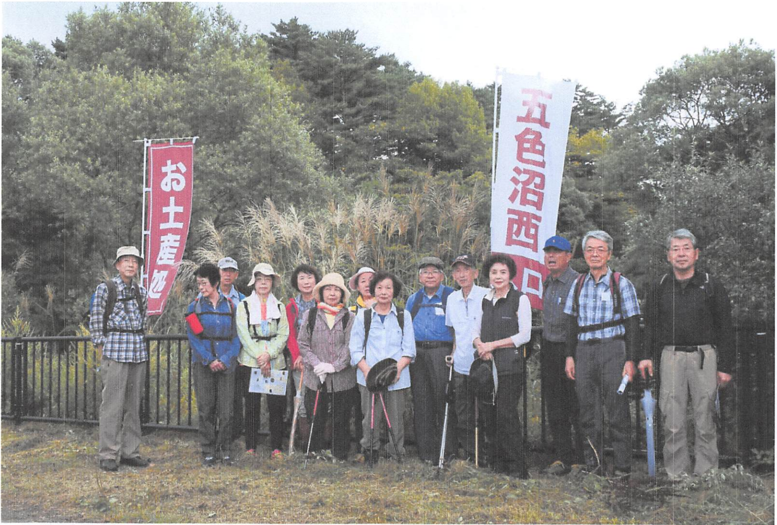
五色沼西入口、心配された天候も薄日のようなハイキング日和です、皆さん心掛けがいいのです。