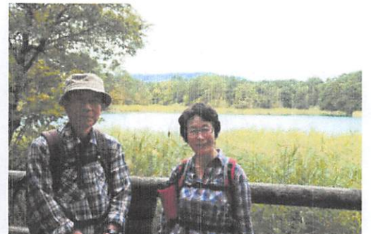
本当に素晴らしいお顔の皆さんです。