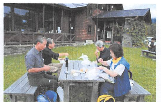
am11:30 お昼やっぱり楽しみですね、朝が早かったから丁度いいのかな。