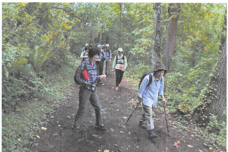
紅葉の時期はさぞかしの人盛りかな。