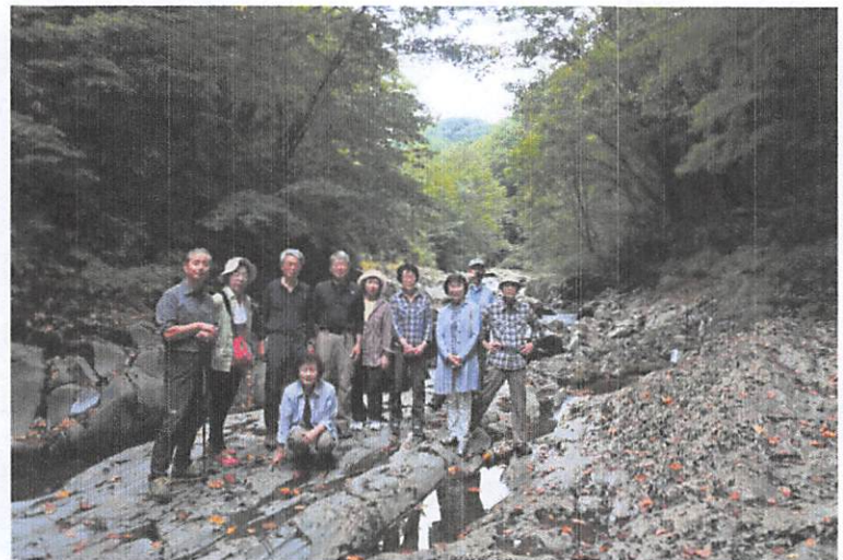
下って、下っての中津川溪谷、帰りが心配と云っていた一枚。