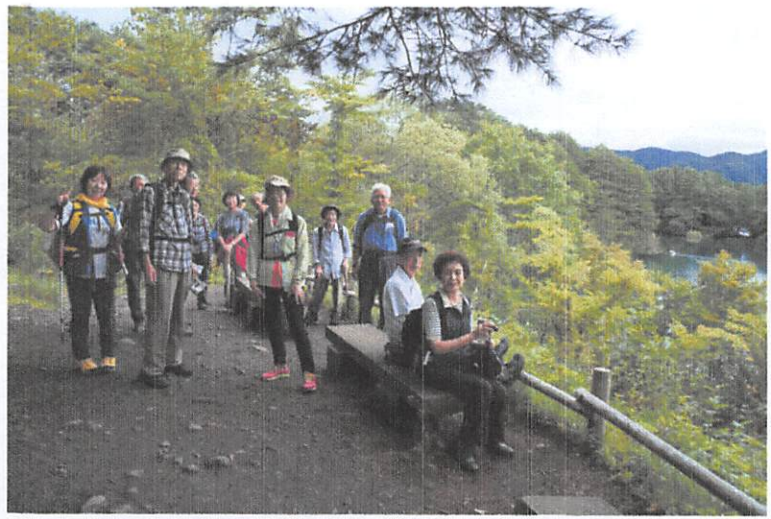
高低差の無い林間のトレッキングコース、ベンチ有、展望良し、紅葉には少し早いですが結構たくさんの方が来ている。