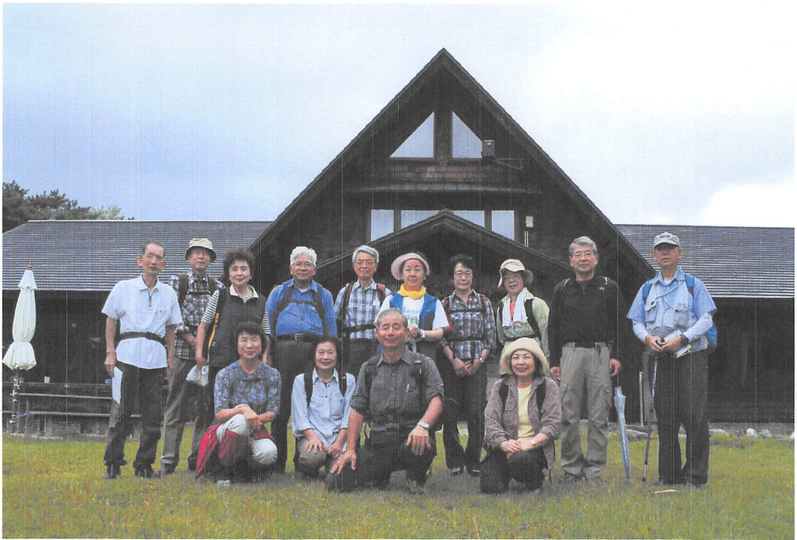
ビジターセンター前、お昼食べて満足顔。