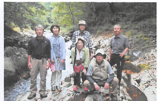
今回は湖沼群を巡るトレッキングから溪谷までの楽しく歩いた良い一日でした。