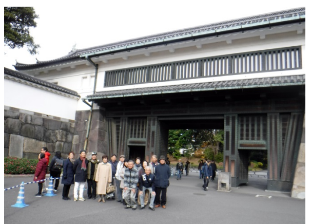
大手門の内（皇居内）及び外（皇居外）