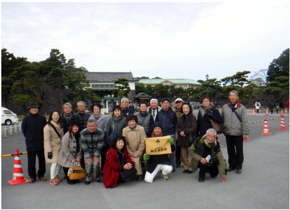
0年秋季皇居乾通り一般公開、坂下門前手荷物・身体検査前