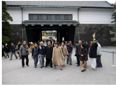
立ちどまらないでくださいの声の中で