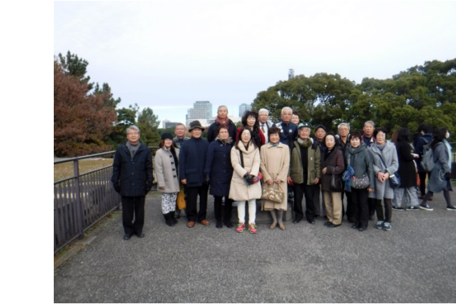
乾通りから東御苑に。