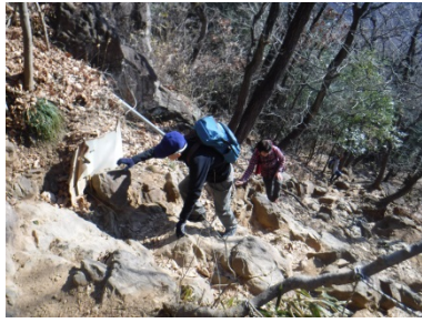
トンビ岩への急登