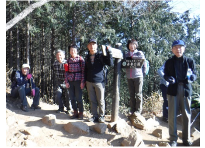
トンビ岩で小休憩