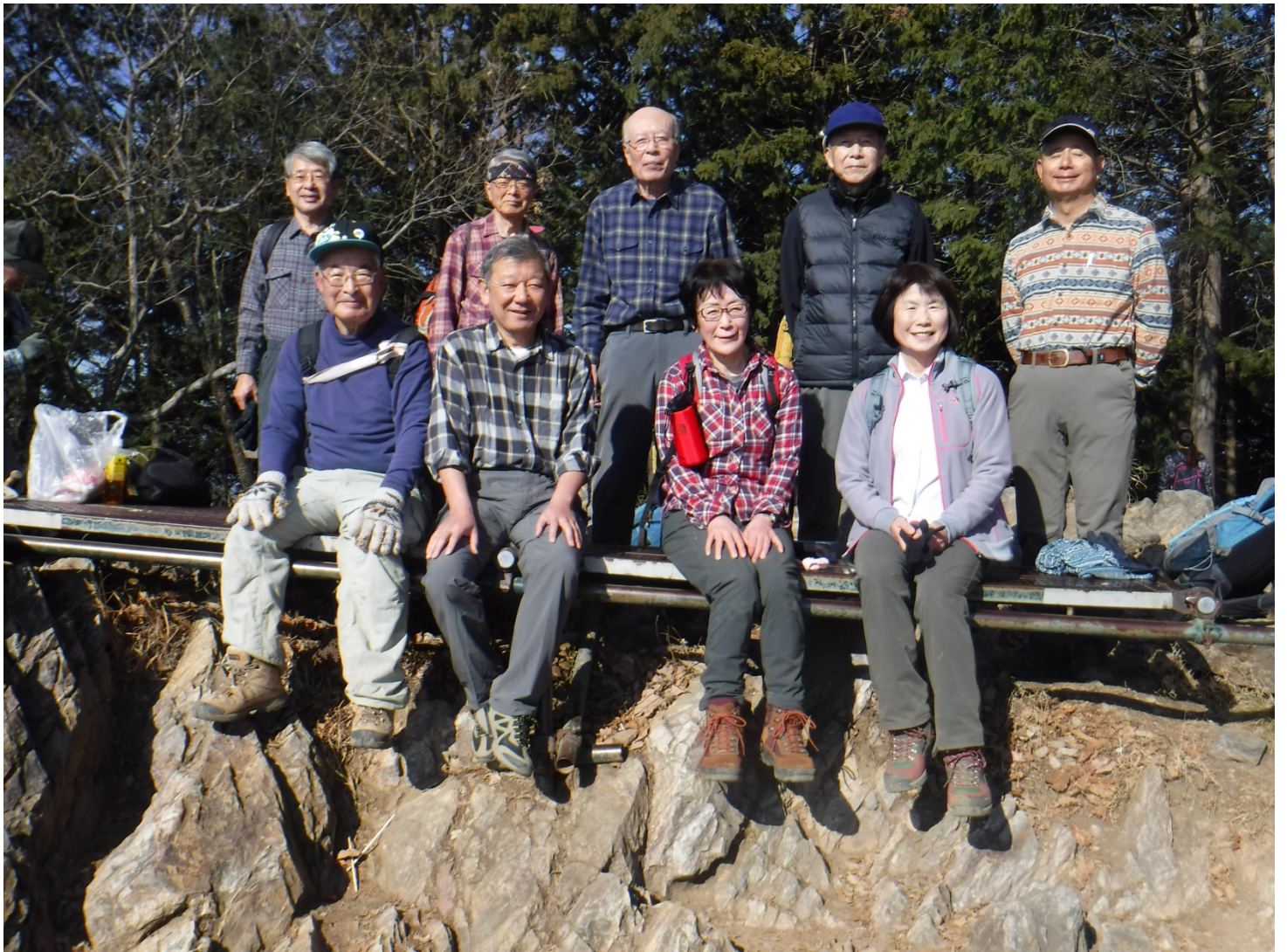
吾妻山山頂（483m）天気がよく、遠くは残念ですが霞んでいる（富士山・スカイツリーは残念）