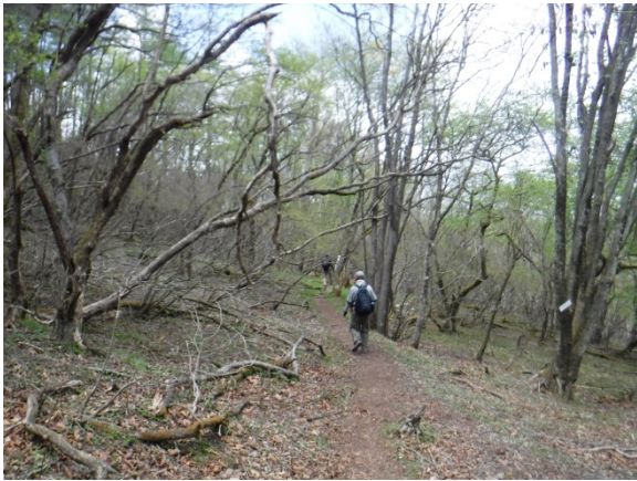
横根山から方寒山へ