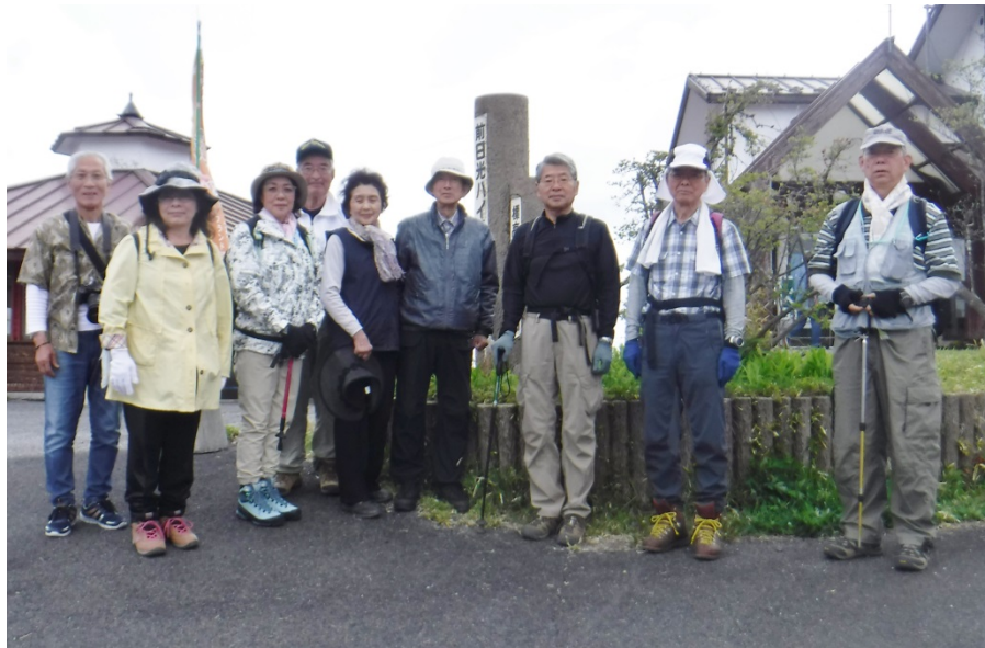
前日光ハイランドロッジ前・皆さん勢揃い