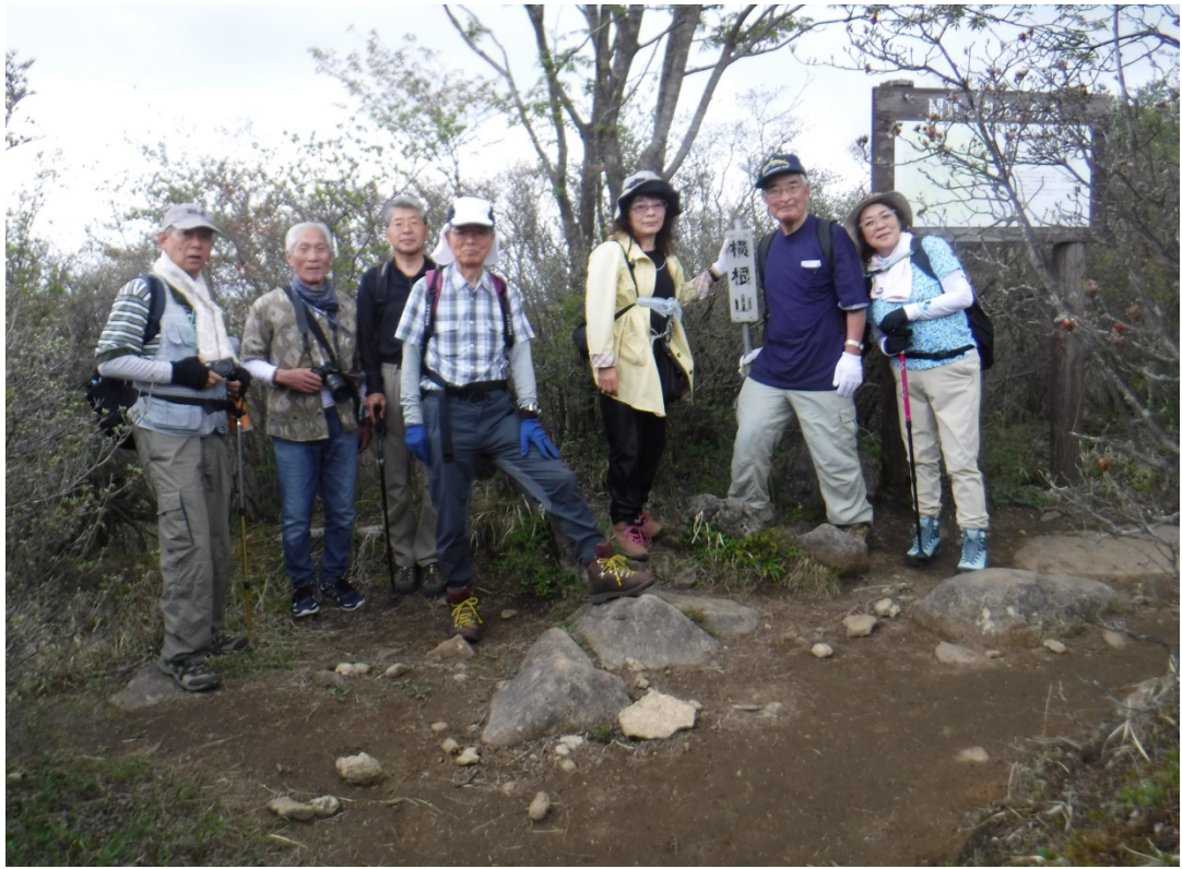
山頂で記念の一枚