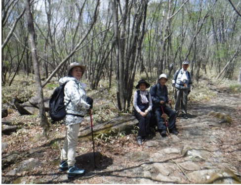
歩いては休むいいですね