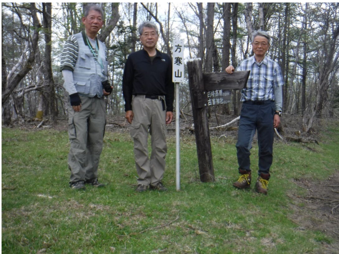
こちらも山頂です