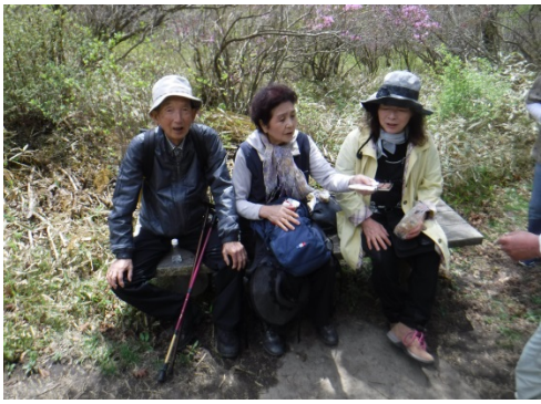
小休憩・ひとついかがですか