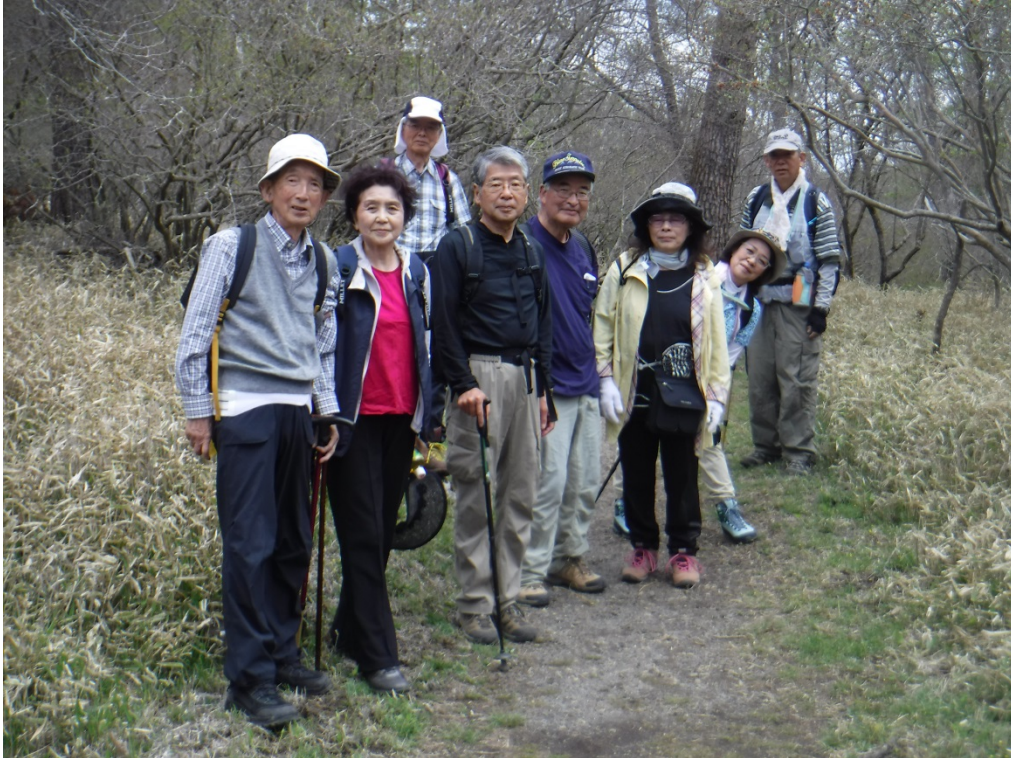
皆さん素晴らしいお顔です