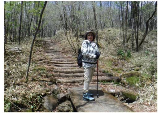
山ガールデビューのわたし