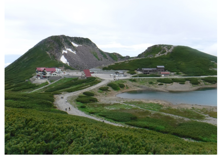
畳平 (2,702m) 全景 (ここまでバスで来られる・乗用車乗り入れ禁止)