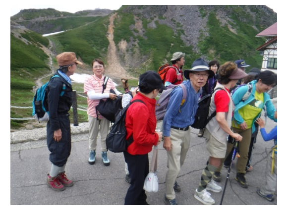
出発前のひと時・NO1 パトロールセンター 出発前のひと時・NO2