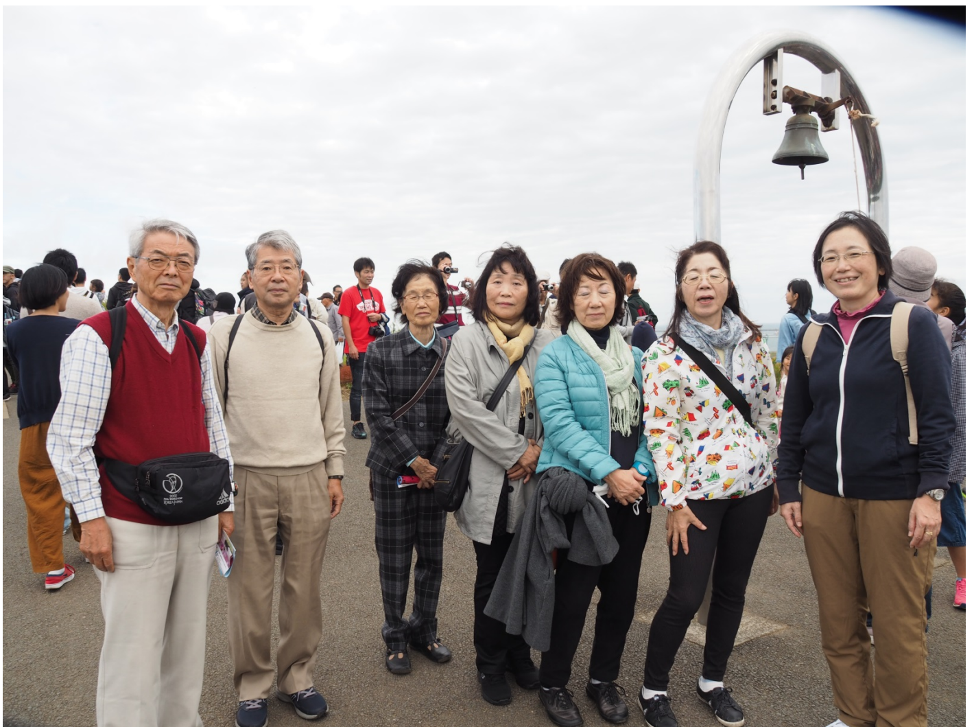
こちらは混雑の流れの中を上手に歩いてコキアの見学ができたようです