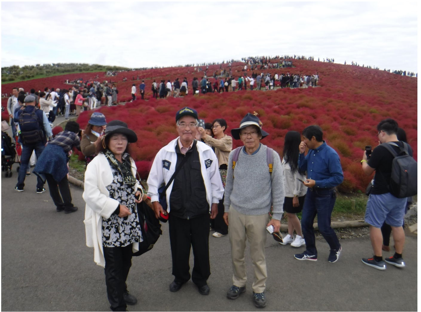
こちらはゆっくり歩いてのマイペース、まだまだ登らなくては見学が終わりません