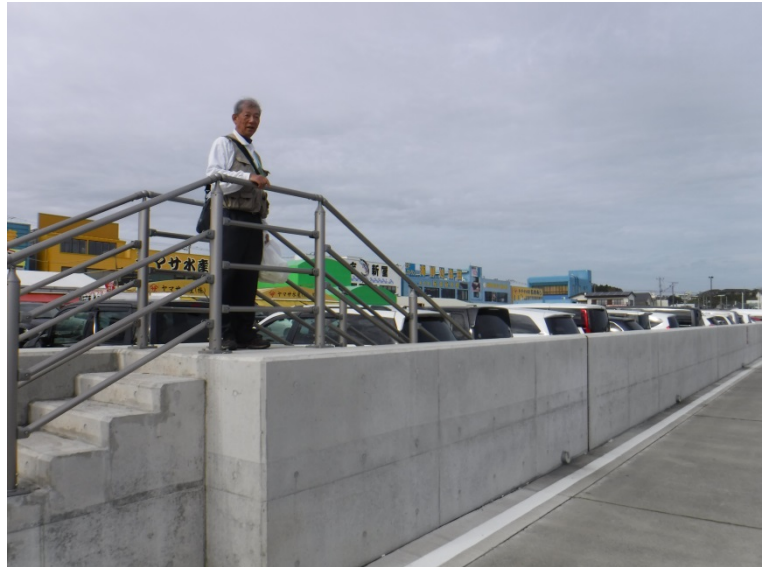
那珂湊で自由昼食、出発時間まで市場や港を散策、やっぱり海は良いね