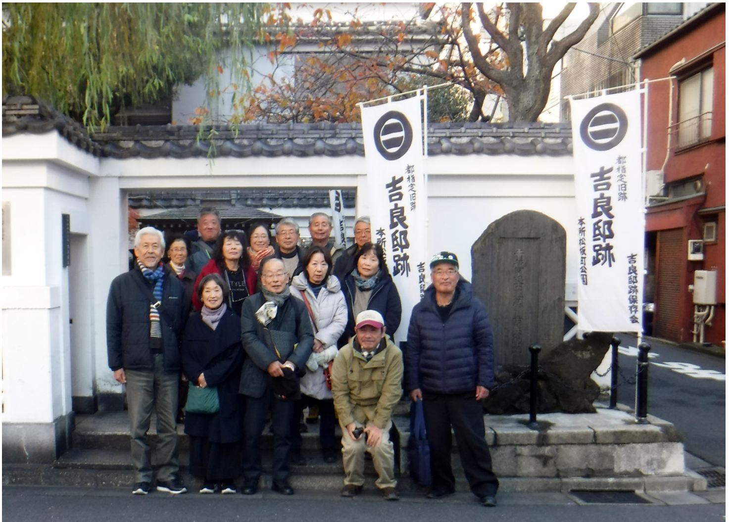
吉良邸跡（本所松坂町・現在は墨田区両国三丁目13番9号）