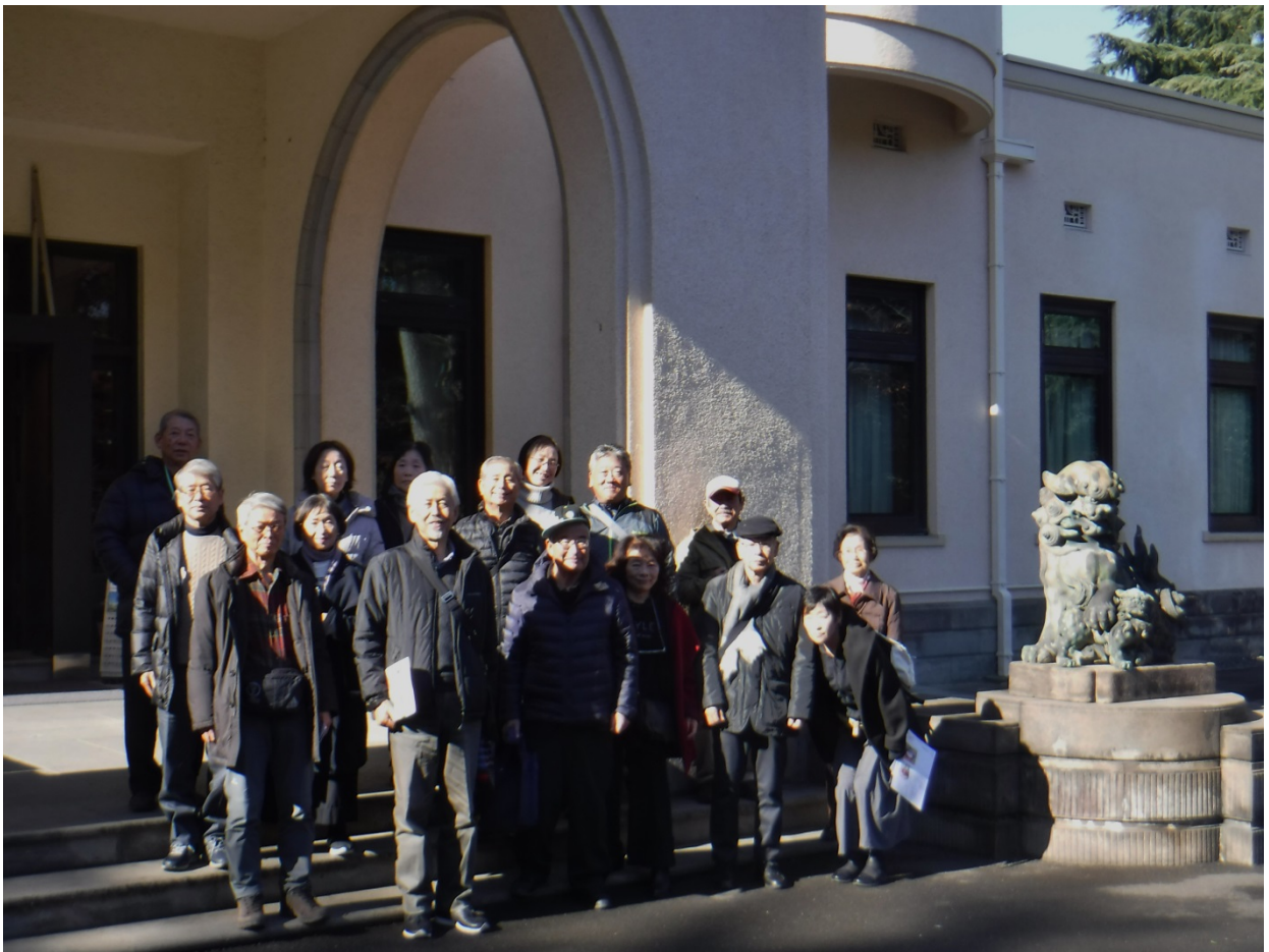
東京都庭園美術館（旧朝香宮邸）