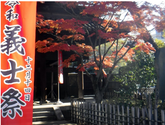
今日は8日です、6日後であれば義士祭。