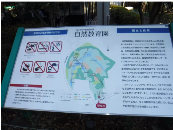
国立科学博物館付属自然教育園案内