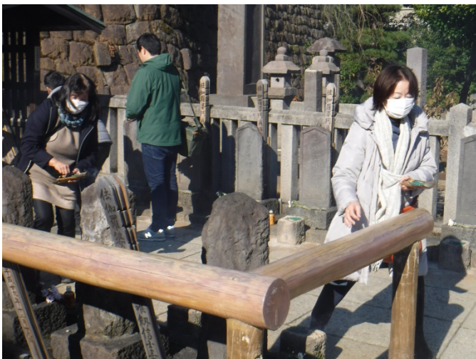
参詣者が絶えない義士の墓