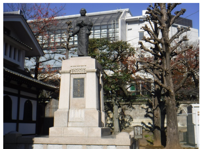
大石内蔵助良雄銅像