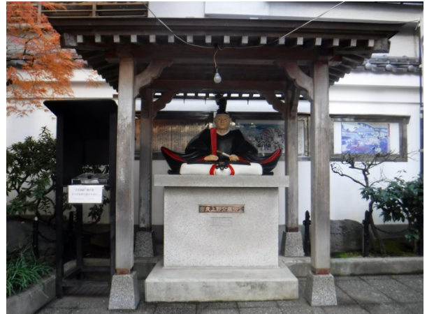
吉良上野介義英公